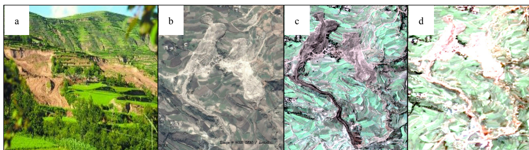
图 2 典型滑坡代表——永光村#1 和#2 滑坡

a—照片；b—Google Earth 影像；c—Pleiades 影像 (0.5m)；d—高分影像 (2.1m)