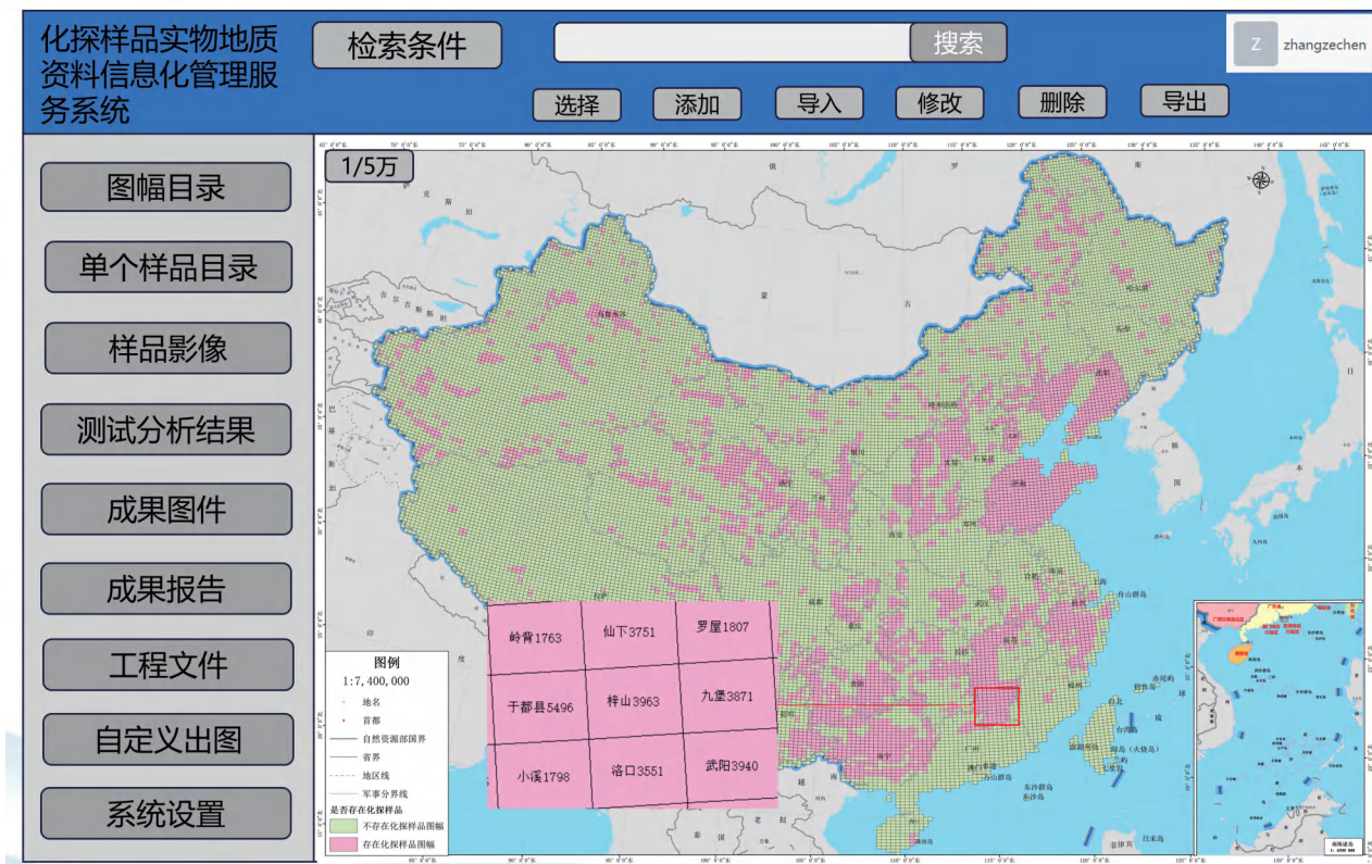
图2 样品实物地质资料信息化管理服务系统界面设计简图