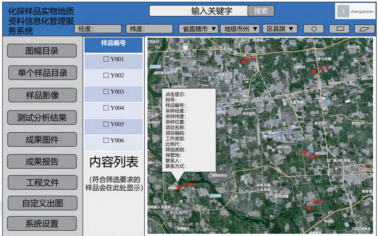
图5 样品实物地质资料信息化管理服务系统定向检索界面简图