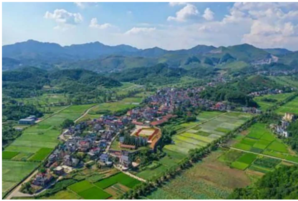
图2 江山市莲塘村全貌