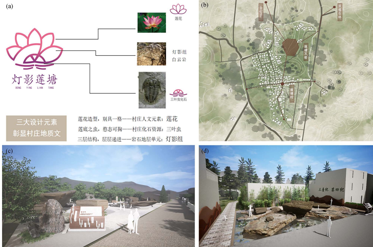
图4 江山市莲塘村地质景观基因提取及建构:(a) 莲塘村标志图;(b) 莲塘村空间结构; (c) 震旦纪节点;(d) 三叠纪与第四纪节点

(2)结合具体村落的地形地貌、空间结构、居住模式和道路组成等要素,选取合适空间建设地质科普旅游风情廊道。