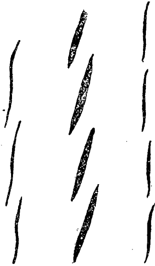
圖 3. 几种雁行式排列